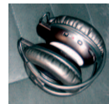
Opvouwbaar design voor eenvoudige opberging in tasje.

Foldable design for travel convenience and easy storage.