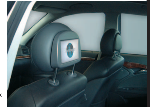
Kunststof kap af fabriek Plastic headrest rear cover delivered ex works