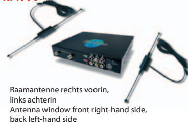
Raamantenne rechts voorin, links achterin Antenna window front right-hand side, back left-hand side